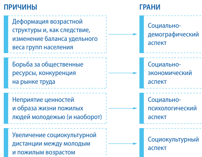
Рис. 3. Причины и грани межпоколенческих конфликтов в современном обществе