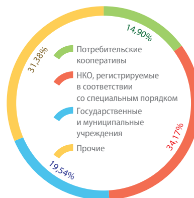
Рис. 1. Виды некоммерческих организаций в СЗФО (на 01.04.2017)

По данным Федеральной налоговой службы, из числа зарегистрированных НКО две трети составляют государственные и муниципальные учреждения и некоммерческие организации, регистрируемые в соответствии со специальным порядком (рис. 1).